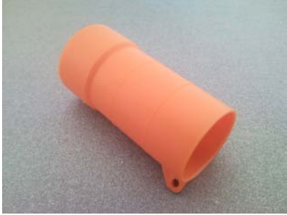
第 10 部分