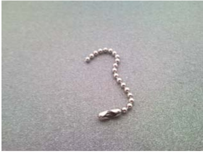
第 14 部分和第 15 部分