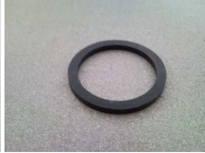
第 11 部分