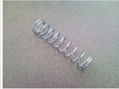
第 16 部分